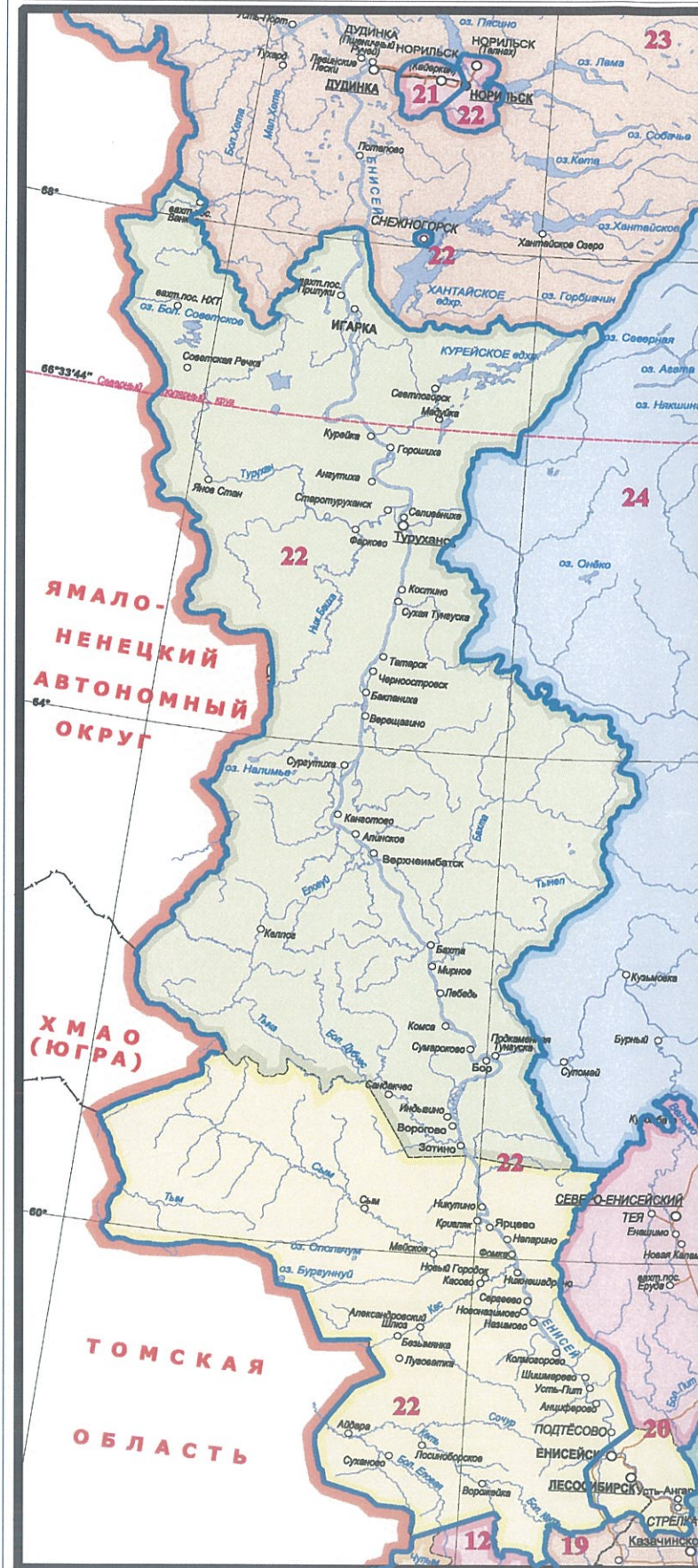
2.4. Графическое изображение одномандатных избирательных округов № 21 и 22, образованных на территории городского округа г.Норильск, Енисейского муниципального округа, Туруханского муниципального округа